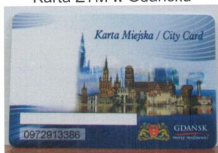
Karta ZTM w Gdańsku