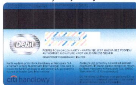
Rewers Miejskiej Karty Płatniczej