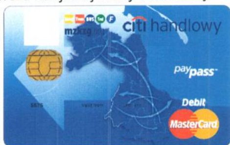
Awers Miejskiej Karty Płatniczej