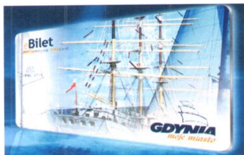
Karta ZKM w Gdyni