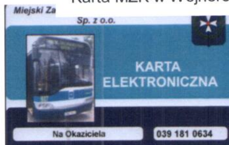
Karta MZK w Wejherowie